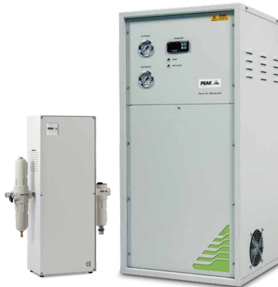
ZA015 & ZA300

“Команда Peak работает, чтобы обеспечить лучшее решение для наших клиентов. Уникальная конструкция генераторов, простота установки и минимальное техническое обслуживание означают, что мы можем предложить Вам экономию ваших финансовых средств”.