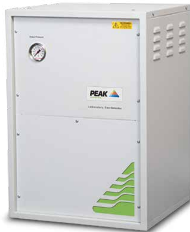
Генератор PSA Nitrogen

“Мы гордимся тем, что поддерживаем научные достижения, и более чем 10.000 наших разработок используются в различных лабораториях».