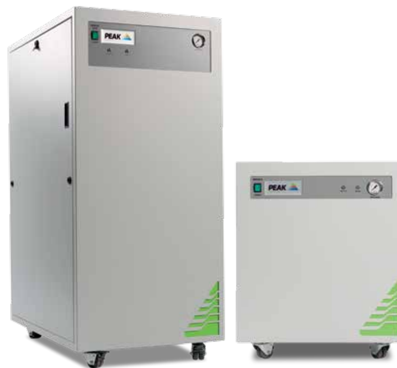
Генераторы Genius 3010 & NM32LA

“... Нам нечего предвосхищать, кроме нашего Genius (Гения)”.