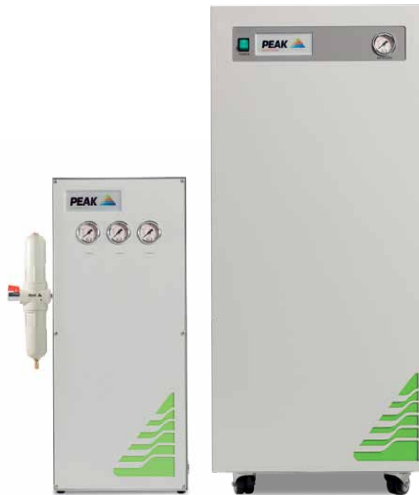
Генераторы: Infinity 1031 & Infinity 5010

Один Infinity генератор предполагает множественное использование. Это устраняет применение дорогостоящих баллонов и значительно сокращает углеродные примеси”.