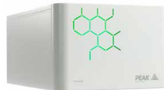
Генераторы Азота - Серия Precision Nitrogen