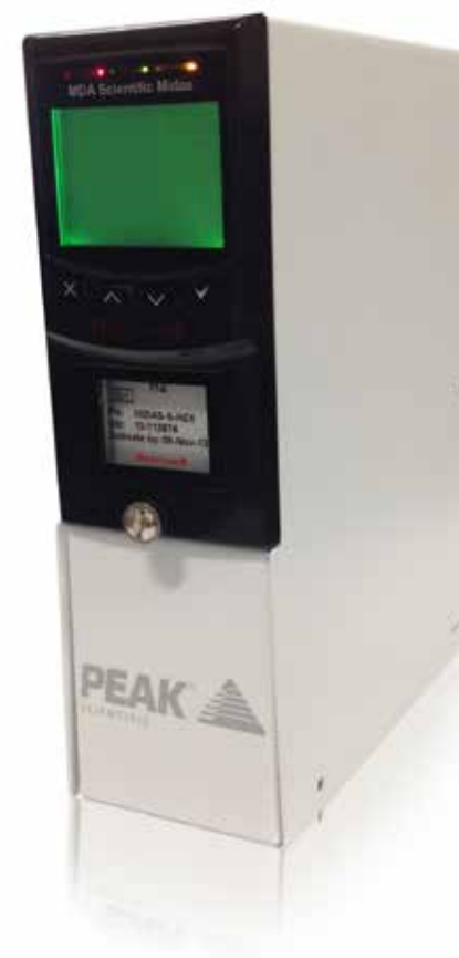
Детектор водорода - Precision Hydrogen Detector

“Строгие условия тестирования Peak генераторов подтверждают высокое качество нашей продукции”.