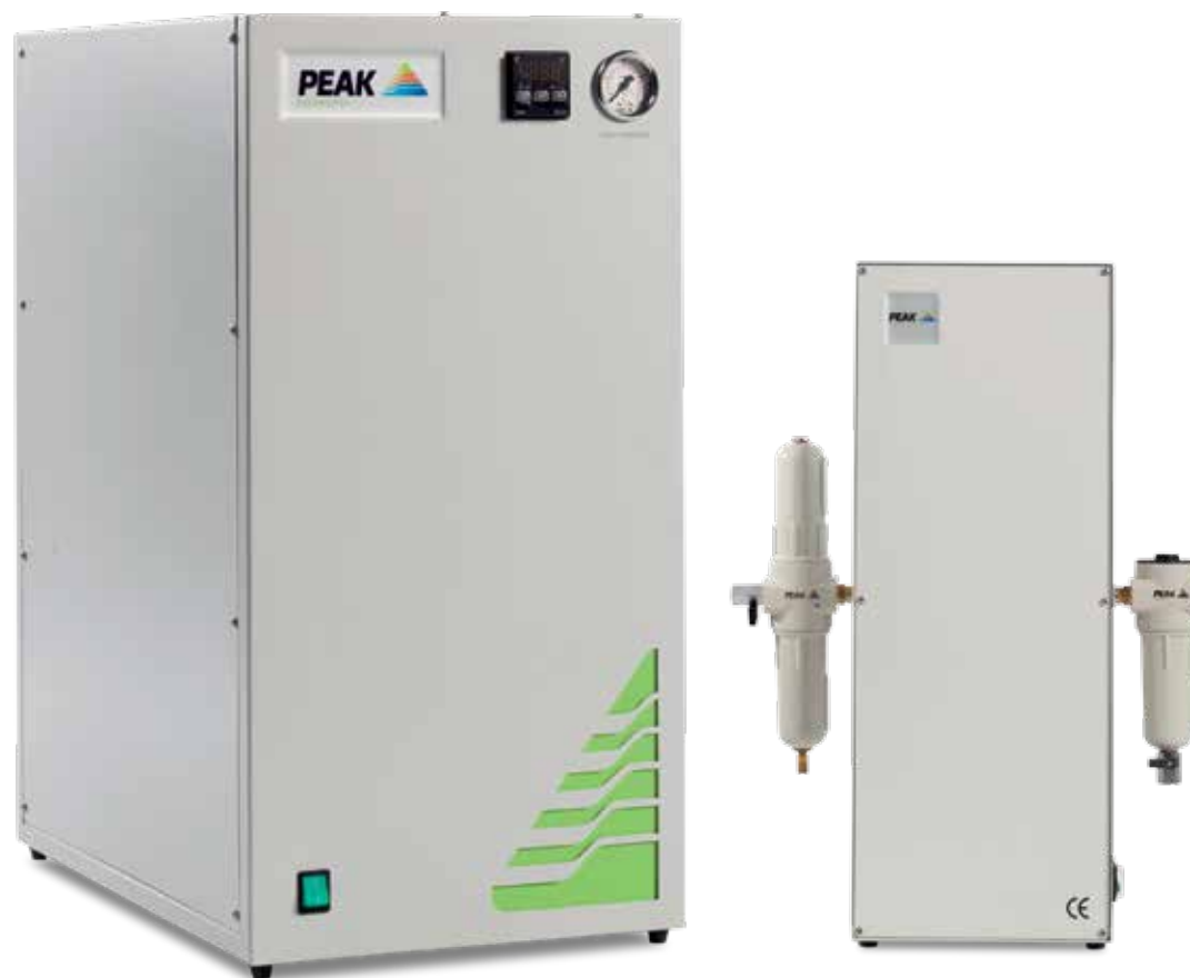
На фото: STOCA & TOC1500

“Все наши генераторы обеспечат превосходные технические лабораторные показатели и, конечно, в стандартную комплектацию входит послепродажное обслуживание мирового класса!”