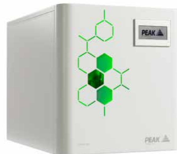
Генератор Водорода серии Precision